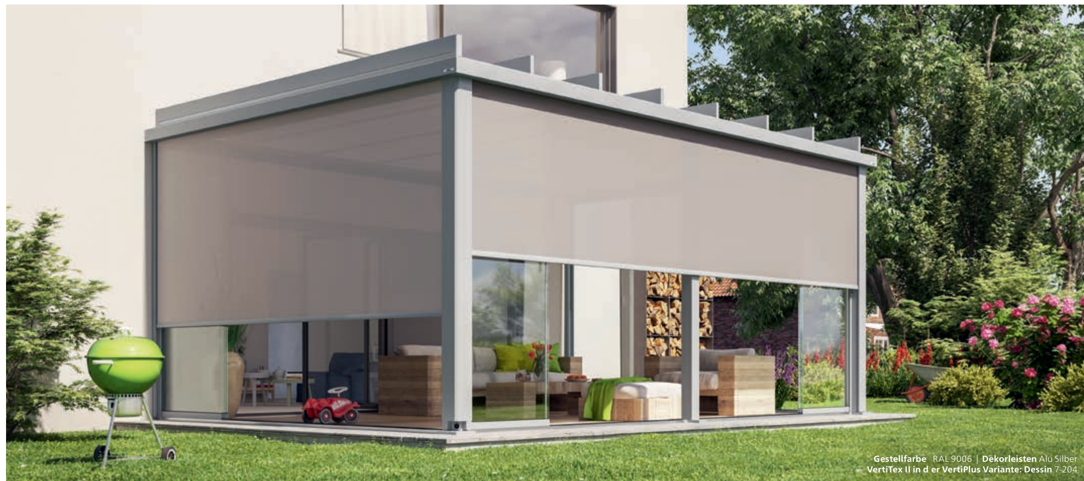
Gestellfarbe RAL 9006 | Dekorleisten Alu Silber VertiTex II in der VertiPlus Variante: Dessin 7-204

Sie möchten von den Seiten und von vorne vor Blicken und blendendem Licht geschützt sein? Dann ist die Senkrecht-Markise VertiTex II von weinor die richtige Wahl. Die speziell für VertiTex II entwickelte Kollektion screens by weinor® umfasst eine große Auswahl an hochwertigen Tüchern. Und das patentierte weinor Opti-Flow-System® gewährleistet einen optimalen Tuchstand. VertiTex II für Terrazza Pure gibt es auch in der optisch attraktiven VertiPlus Variante mit Design-Blenden.*