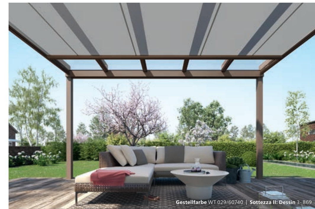
Gestellfarbe WT 029/60740 | Sottezza II: Dessin 3-869

Ein angenehmes Klima auf Ihrer Terrasse verspricht die Wintergarten-Markise Sottezza II . Der dekorative Sonnenschutz ist formschön, schlank, zurückhaltend – und pflegeleicht. Denn Sottezza II ist unter dem Terrassendach angebracht. Das schützt sie vor Feuchtigkeit und Schmutz, das Tuch bleibt attraktiv und sauber.